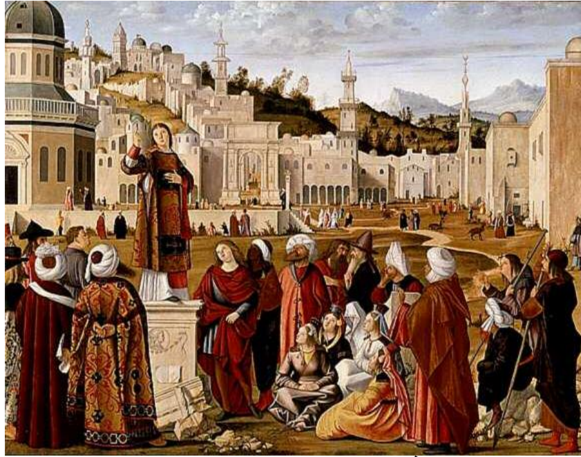
فیتوری کاراپاچیو Vittori Carpaccio

هونهری ئه‌وروپیی سه‌ده‌گانی ناوه‌راست و پینسانس ۲۷۳